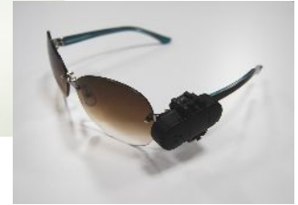
新型自鳴式防犯タグ 「バラエティタグ」