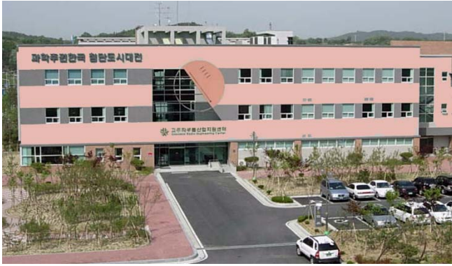
株式会社泰進技術 本社