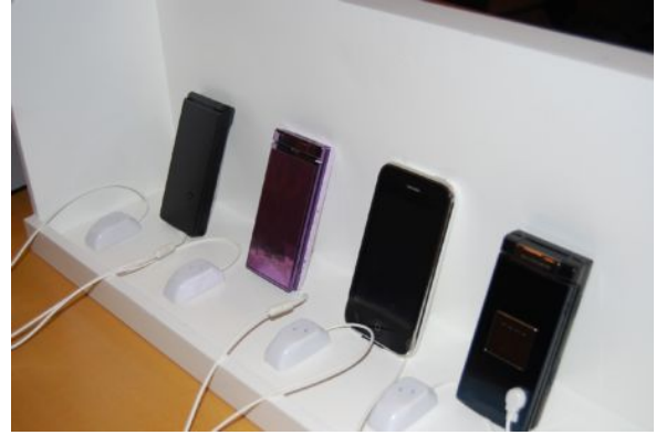
「pipi Eyes (ピピアイズ)」 取り付け例