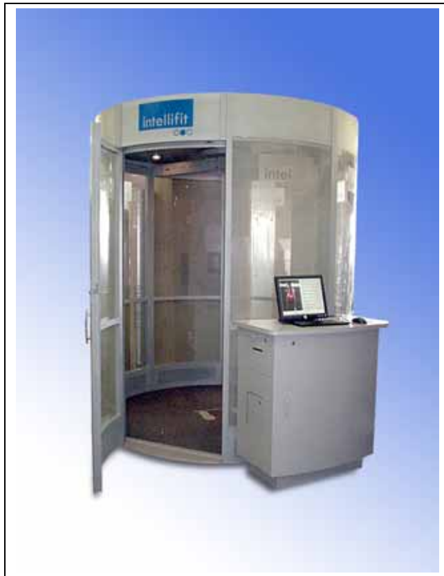
3次元ボディスキャナー「Intellifit」(インテリフィット)