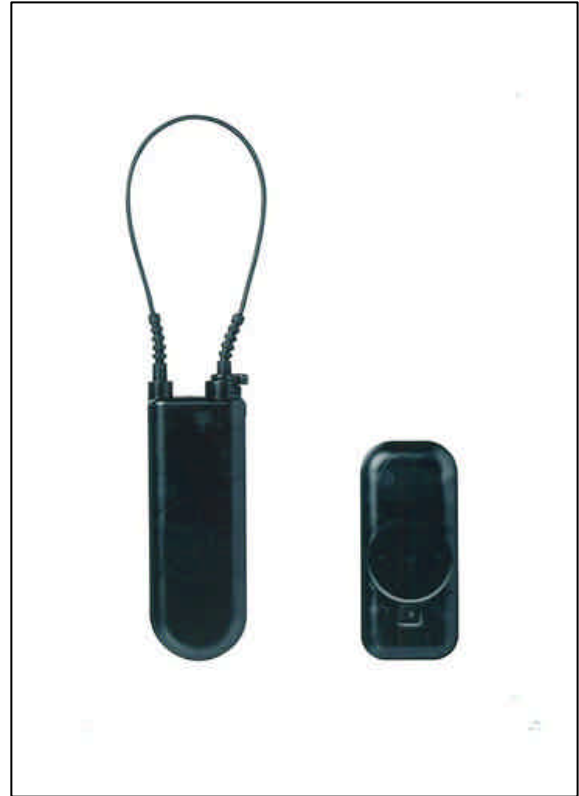
・左 WT4S (ワイヤー式タイプ) ・右 VS4S (ラベル式タイプ)